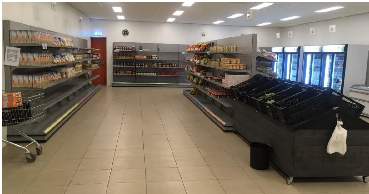
Supermarkt systeem voedselbank Arnhem.