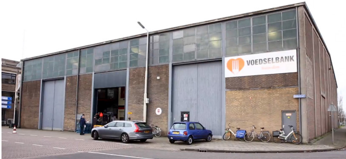
Het distributiecentrum in Rotterdam.

De voedselbank Rotterdam werd in 2002 opgericht en had als doel om voedselpakketten te geven aan huishoudens met een laag inkomen. Op dat moment was de intentie om dit voor een korte periode te doen maar nu 17 jaar later bestaat is de voedselbank Rotterdam er nog en heeft daarnaast een tweede doel gekregen: het verminderen en tegengaan van voedselverspilling. In de huidige situatie worden jaarlijks zo'n 7600 voedselpakketten verstrekt aan ongeveer 5000 huishoudens. De voedselbank Rotterdam is een combinatie van een voedselbank en een distributiecentrum. Deze combinatie komt ook voor bij andere voedselbanken in Nederland. In het distributiecentrum komt voedsel binnen waarvan voedselpakketten worden samengesteld. Deze voedselpakketten worden verspreid naar 30 afhaalpunten in Rotterdam, waar cliënten ze kunnen ophalen. Daarnaast wordt er vanuit het distributiecentrum voedsel naar ongeveer 20 voedselbanken in de regio verspreid. Hiermee bereikt de voedselbank Rotterdam nog eens ongeveer 3100 families.