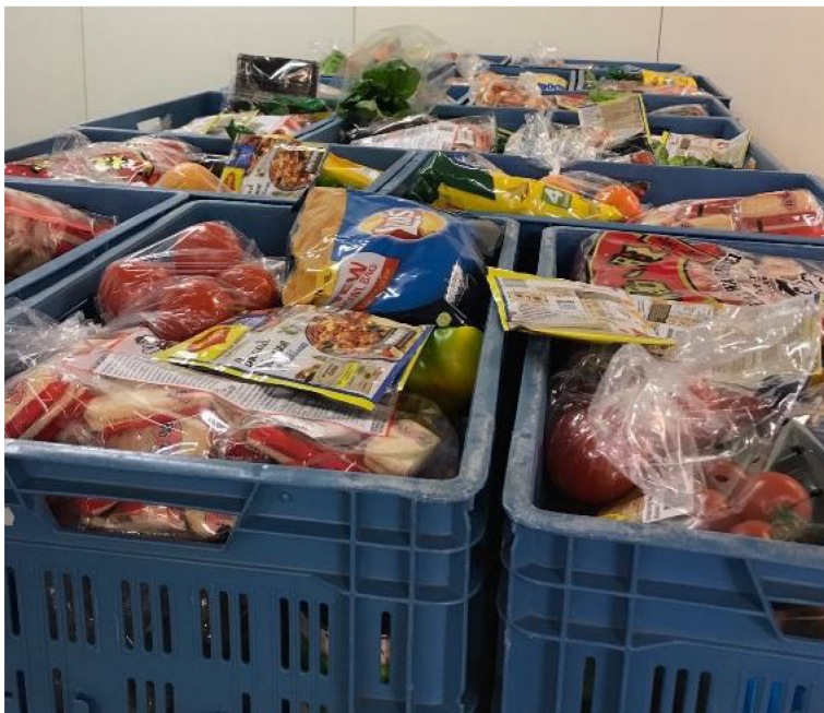
Voorbeeld van voedselpakketten die uitgedeeld worden door voedselbanken.

De voedselpakketten bevatten voedsel voor twee a drie dagen per week, en bieden daarmee ondersteuning op het voedselgebruik binnen een familie.