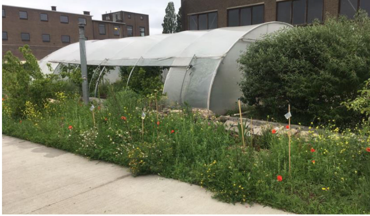
Moestuin in Rotterdam waar cliënten van de voedselbank zouden kunnen werken.