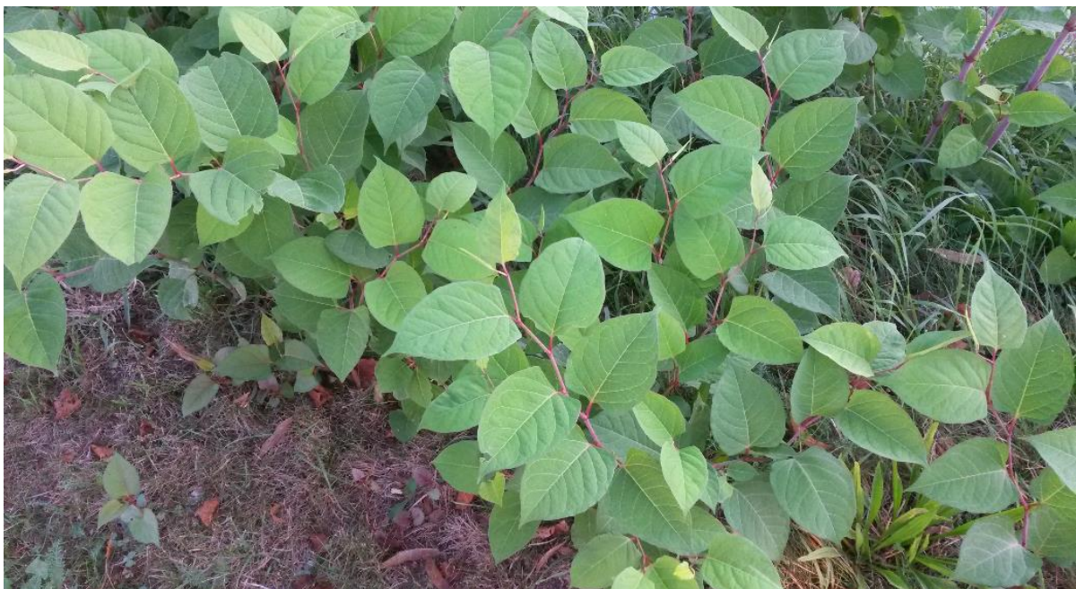
Afbeelding 1: de Japanse duizendknoop

Aziatische duizendknopen bestaan met name uit vrouwelijke planten, waardoor natuurlijke verspreiding via de zaden vooral snog niet relevant is. Aziatische duizendknopen verspreiden vegetatief via de stengel(knopen) en de wortels, waarbij plantendelen van een à twee gram al kiemkrachtig zijn.