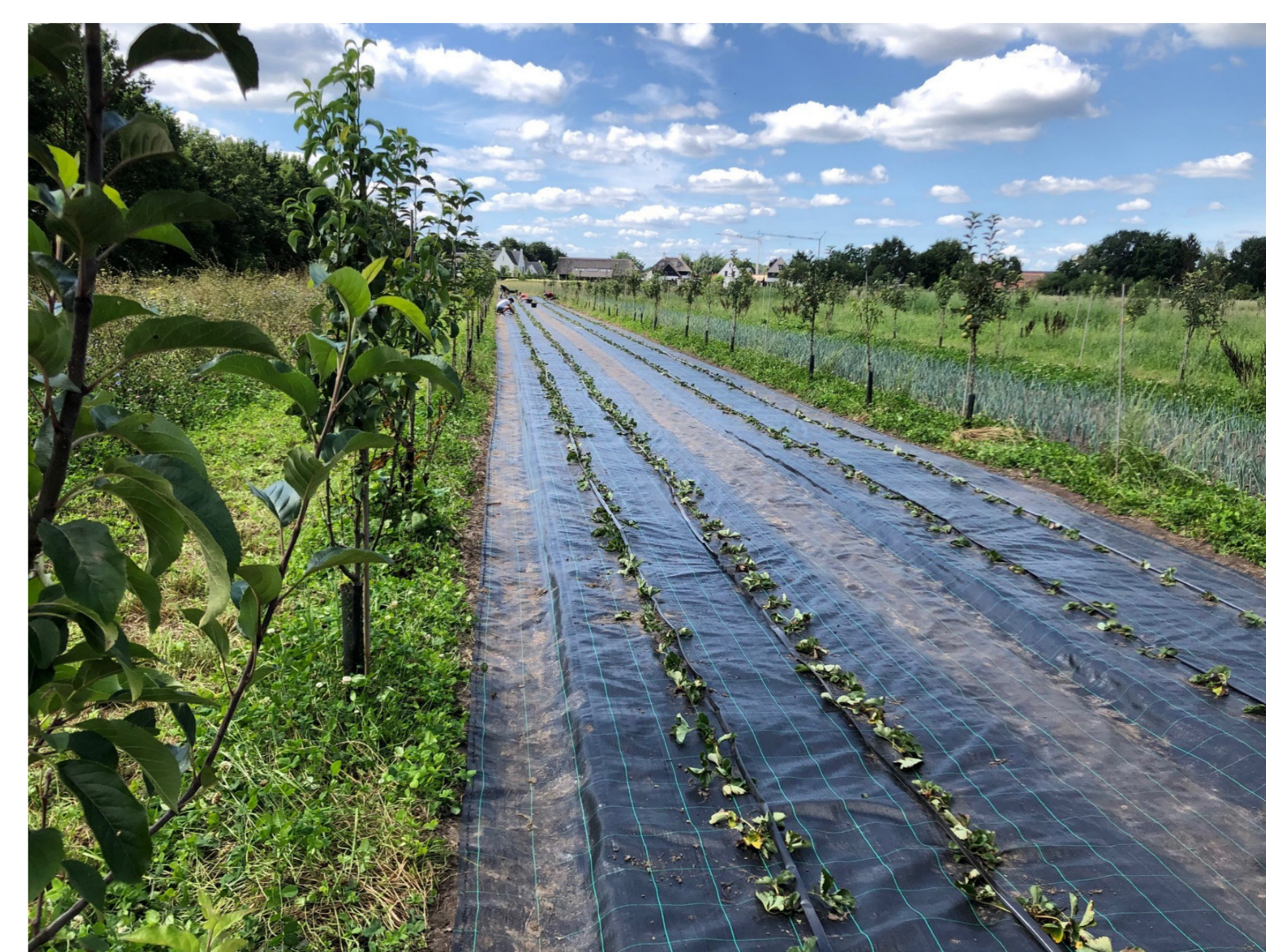
Figuur 3. Herenboeren Grote Heide in Soerendonk