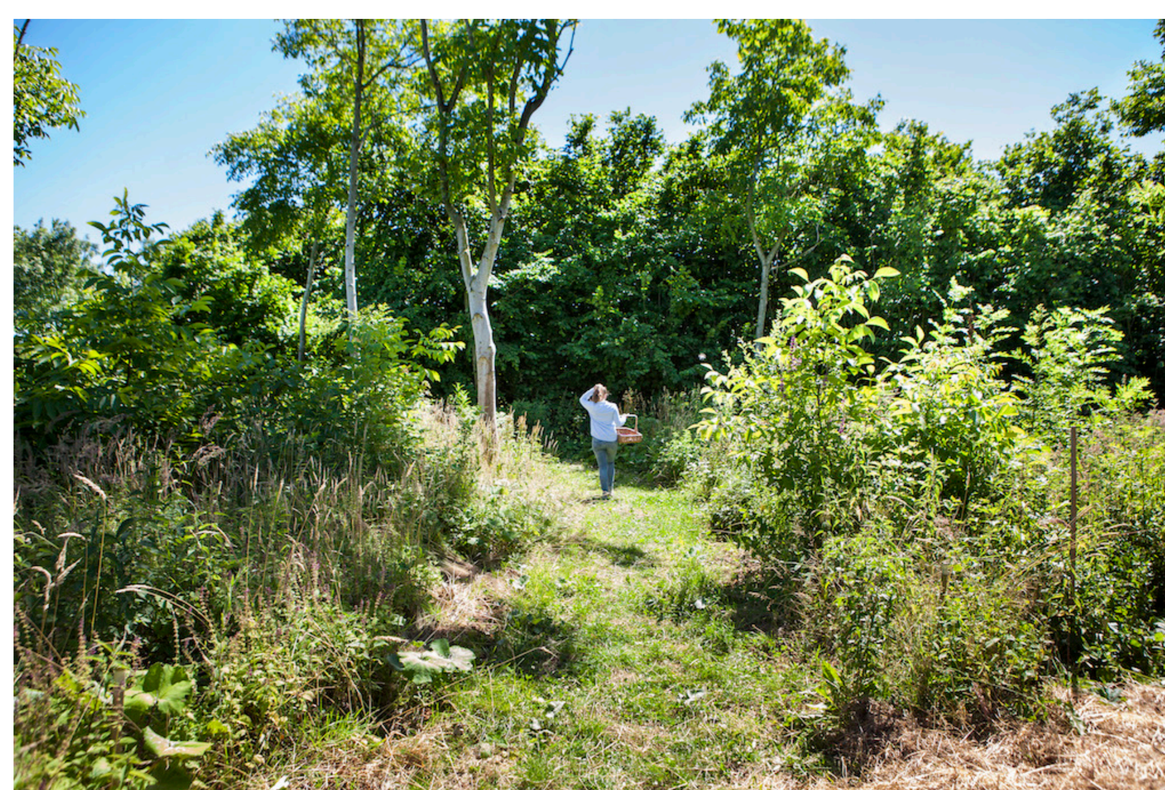
Landgoed en proeftuin Roggebotstaete