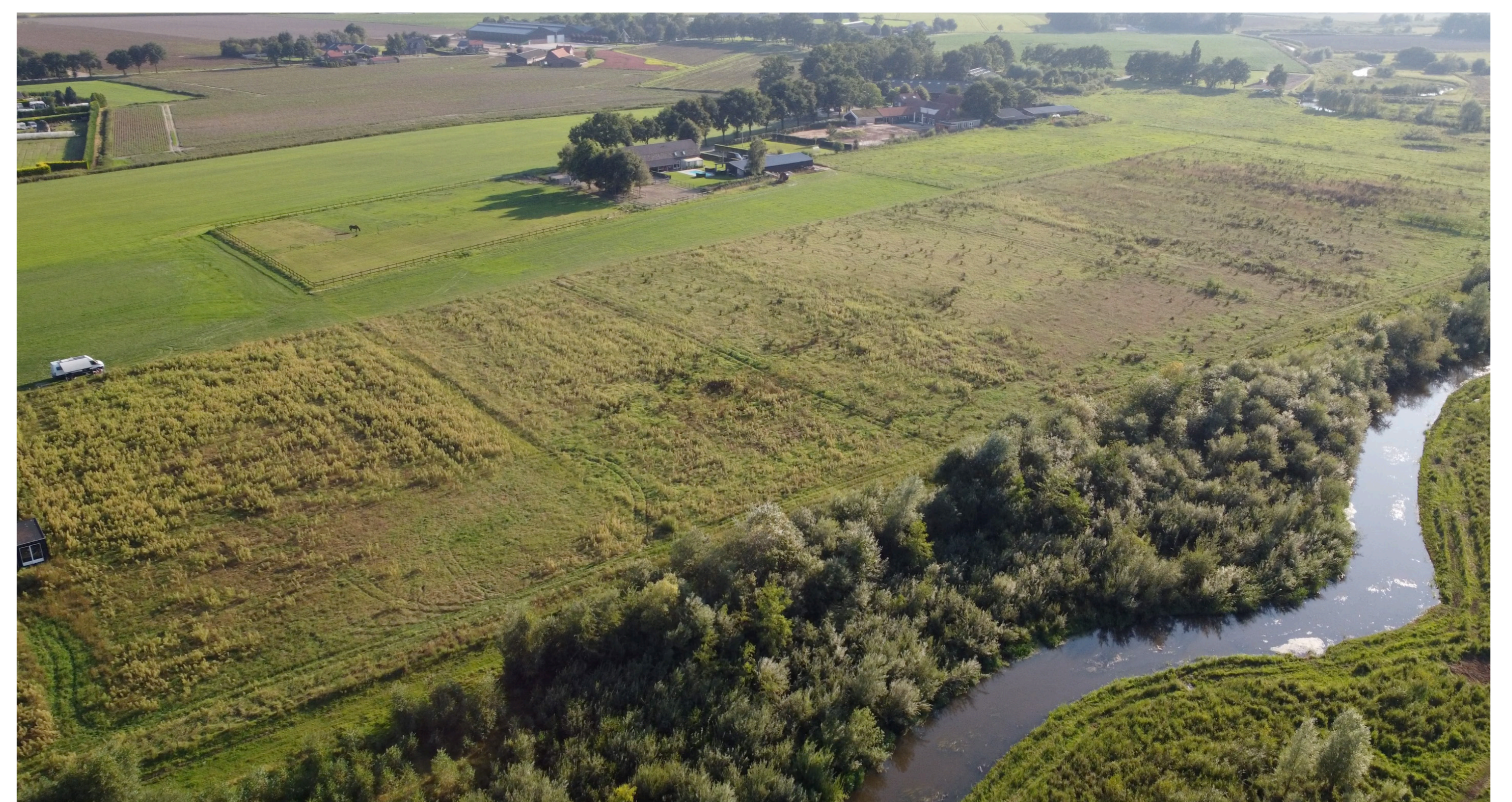
Figuur 1. Bedrijf en beekbuffer