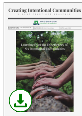
Creating Intentional Communities

Voorbeelden van Eco-Villages waarbij bewoners zijn geïnterviewd zijn: