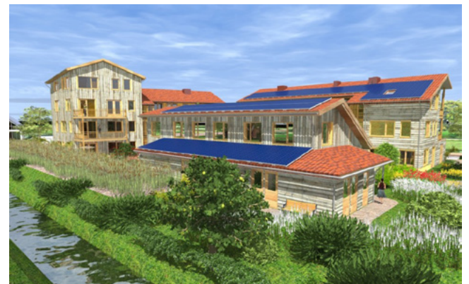
Helofytenfilter, zonnepanelen en permacultuurtuin

sustainability, collaboration and exchanging with their environment and interested parties, sincerely connecting being in the here and now, transparency and responsibility.