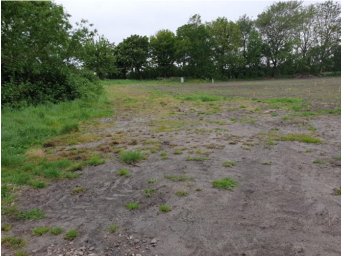
Figuur 3: Foto van terrein LiberTerra Geestmerambacht op 13 Mei 2020

Echter, het creëren van een tijdelijke gemeenschap met woon-, leer- en werkfuncties op een nieuwe locatie heeft per definitie te maken met een grote diversiteit aan stakeholders. Uit eerdere ervaringen is gebleken dat het betrekken van de lokale bevolking, organisaties en bedrijven een belangrijke succesfactor is. LiberTerra heeft op dit moment geen overzicht over welke lokale groepen