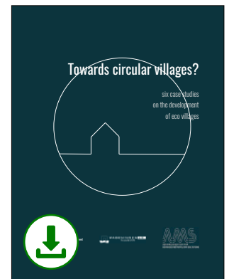
Towards circular villages