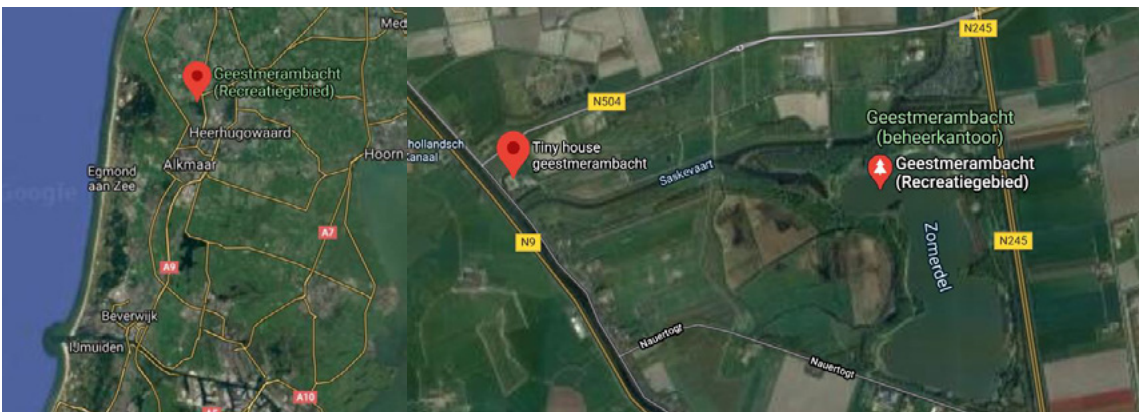
Figuur 1. Geografische locatie LiberTerra

gehuurd wordt van het recreatieschap Geestmerambacht (figuur 1, 2 & 3). Met het project proberen de toekomstige bewoners meer te zijn dan een tiny house gemeenschap die losstaat van de omringende gemeenten. Er wordt gehoopt op een duurzame verbinding met relevante groepen uit de nabije omgeving.