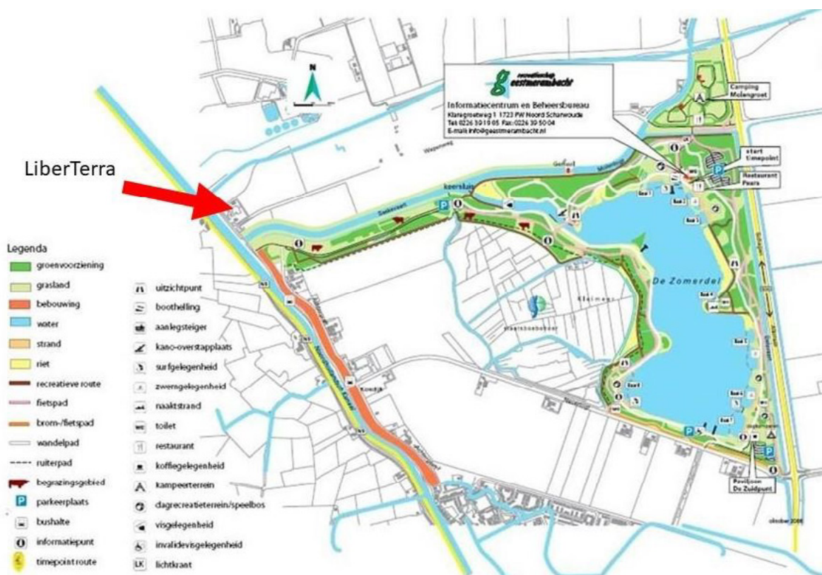
Figuur 2: Recreatieschap, Geestmerambacht