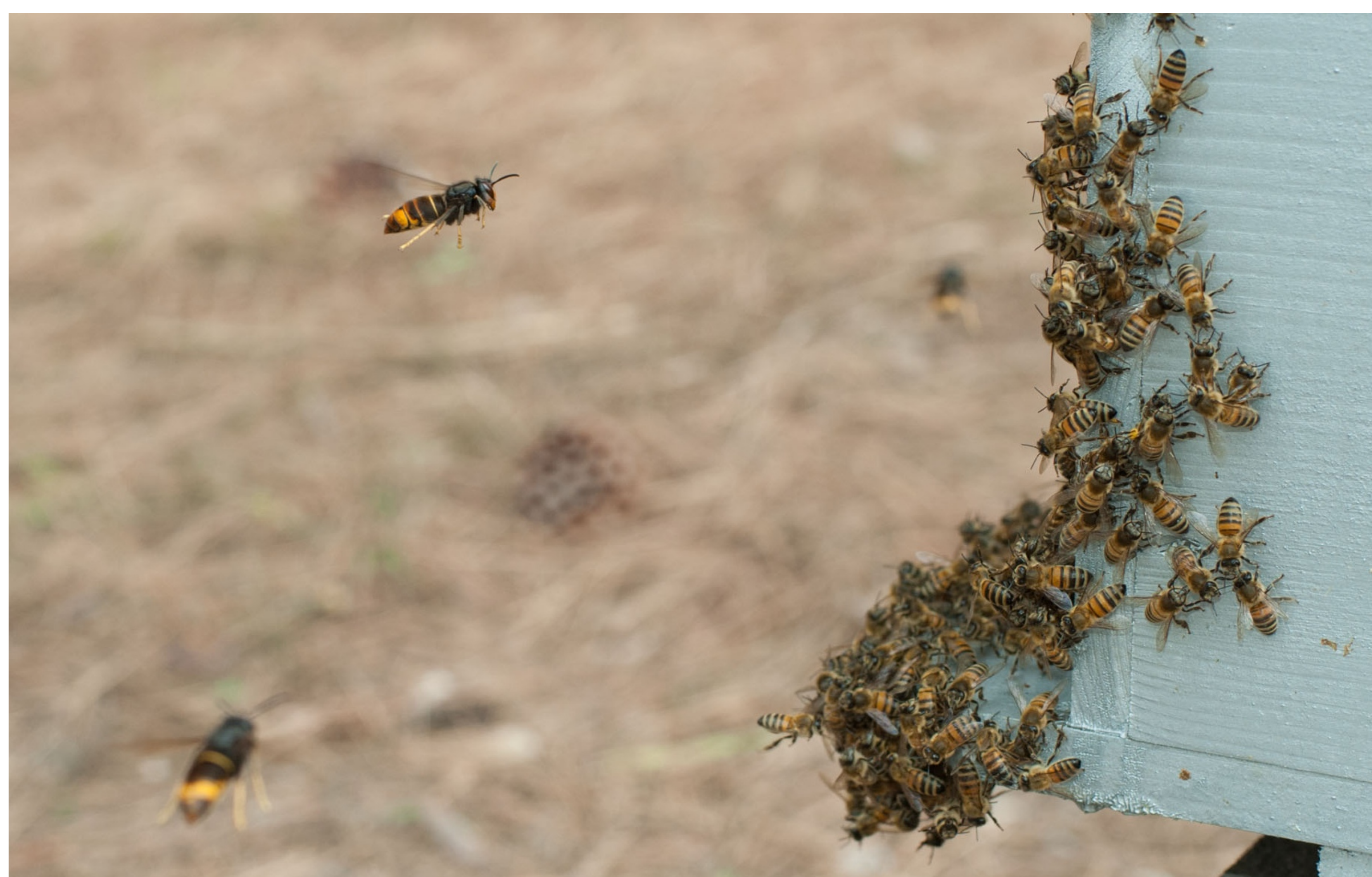
Figuur 3. Aziatische hoornaars, jagend op honingbijen bij een bijenvolk.