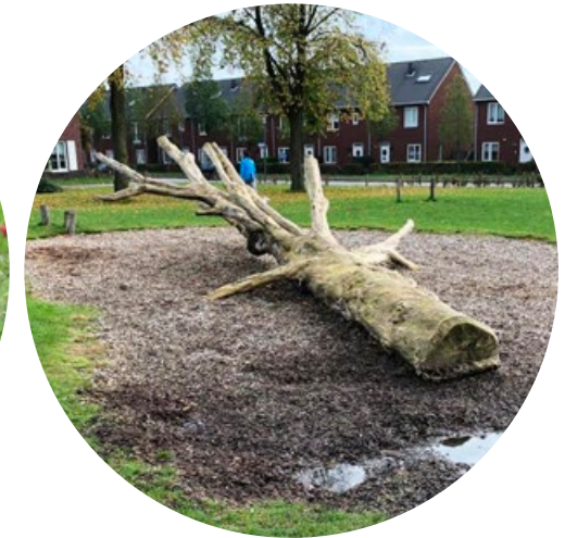
Voorbeelden uit de fotoset