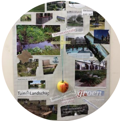
Resultaat: een moodboard

Tijdens de brainstorm worden de foto's in de ruimte verspreid en wordt een kwartier ingelast waarin de deelnemers afbeeldingen mogen verzamelen die hen aanspreken. De deelnemers kunnen de hele afbeelding gebruiken of stukken uit de afbeeldingen knippen die ze belangrijk vinden.