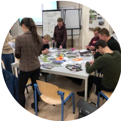
Aan de slag met de foto's

De fotoset is te gebruiken door alle afbeeldingen in kleur af te drukken op A4 papier. Door het dubbelzijdig af te drukken komt als het goed is de titel van de foto automatisch op de achterkant te staan. In totaal zijn er 62 afbeeldingen. Voor het proces is het goed als elke deelnemer minimaal 4 afbeeldingen kan kiezen. Eén set is dus voldoende voor ongeveer 15 personen. Bij een groter aantal deelnemers kan de set tweemaal worden afgedrukt.