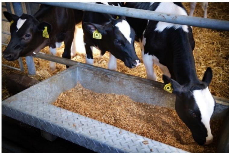
Gescheiden jongveehuisvesting verkleint de kans op besmetting met Paratuberculose.

Bedrijven met een A-status kunnen voor bewaking volstaan met tweejaarlijks individueel bloed of melkonderzoek. De andere bedrijven moeten dit onderzoek jaarlijks laten uitvoeren. Uit de monitoring door de GD blijkt dat in het eerste kwartaal van 2023 82% van de melkveebedrijven status A had, en dat 98% een status had.