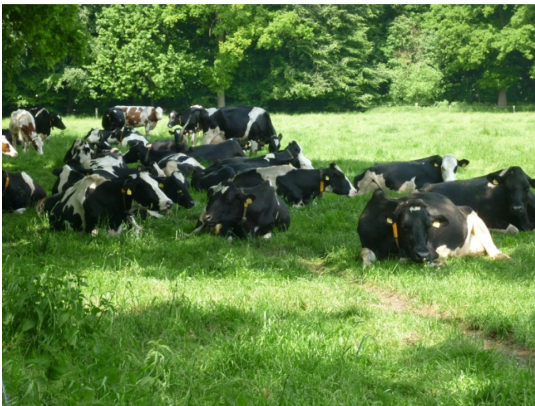
Weidegang draagt bij aan natuurlijk gedrag van koeien.

Dierenwelzijn krijgt tegenwoordig veel aandacht vanuit de maatschappij en de wetgever, en is een van de maatschappelijke duurzaamheidscriteria van kringlooplandbouw. Daarbij is niet alleen de mate waarin dieren ongerief ondervinden een belangrijk beoordelingscriterium, maar er spelen ook andere elementen een rol zoals opvattingen over hoe de mens met landbouwhuisdieren dient om te gaan. Ook bij afwezigheid van ongerief kan er daarom naar maatschappelijke opvattingen sprake zijn van welzijnsproblemen. Voor de melkveehouderij geldt dit bijvoorbeeld in zekere mate voor de discussie over weidegang. Weliswaar geeft weidegang in vergelijking met de omstandigheden in veel stallen de dieren meer mogelijkheden om natuurlijk gedrag uit te voeren en biedt de omgeving meer prikkels, maar 's winters is weidegang meestal geen optie en moeten de dieren ook langere tijd binnen blijven. Daarom moeten stallen zodanig worden ingericht dat ze een goed comfort leveren en een goede hygiëne kan worden gehandhaafd, ook voor bedrijven die weidegang toepassen. In het algemeen zorgen veehouders goed voor hun dieren, maar incidenteel is sprake van dierverwaarlozing. Bij vermoedens hiervan kan een melding worden gedaan bij het vertrouwensloket welzijn landbouwhuisdieren .