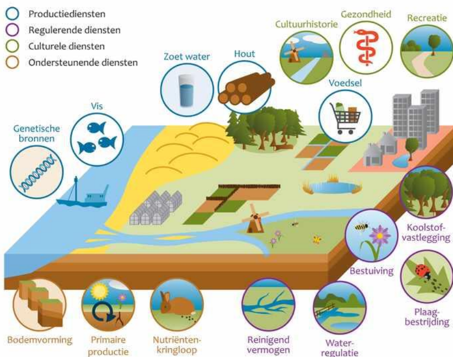
Figuur 3: Overzicht ecosysteemdiensten

In een enquête onder studenten is gevraagd welke ecosysteemdiensten van de campus zij het belangrijkste vinden en in welke landschapselementen zij dat vooral terug zien. Daaruit blijkt dat zij vooral waarde hechten aan culturele diensten. Elementen die recreëren en ontspannen ondersteunen, zoals grasvelden, bomengroepen en waterpartijen, scoren het hoogste. De regulerende diensten van het groen worden erkend, maar vooral gezien als een waarde in het algemeen belang.