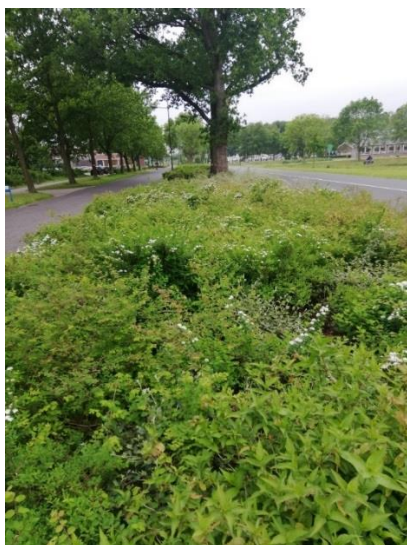
Lint van 5 sierheestersoorten die niet te hoog worden, jaarrond wat te bieden hebben en zowel tegen schaduw, felle zon, droogte als natte voeten kunnen.

Het Nederlands Soortenregister geeft een actueel en volledig overzicht van planten- en diersoorten die in Nederland voorkomen. Nederlandse specialisten brengen hier de informatie uit andere bronnen samen en bepalen de status van een soort volgens vastgestelde criteria. Bijvoorbeeld of een soort op eigen kracht Nederland heeft bereikt of door de mens is binnengebracht en hoe deze zich (voortplantend) heeft weten te handhaven. Hierdoor ontstaat een theoretische scheidslijn tussen inheems en uitheems, waarbij de status van een soort in de loop van de tijd kan wijzigen. Bijvoorbeeld doordat het verspreidingsgebied van dieren- en plantensoorten in ons deel van de wereld naar het noorden verschuift door temperatuurverandering. Ook heeft de tuincultuur in Nederland gezorgd voor de introductie van soorten, die langzaam maar zeker als geaccepteerd onderdeel van ons landschap worden gezien.