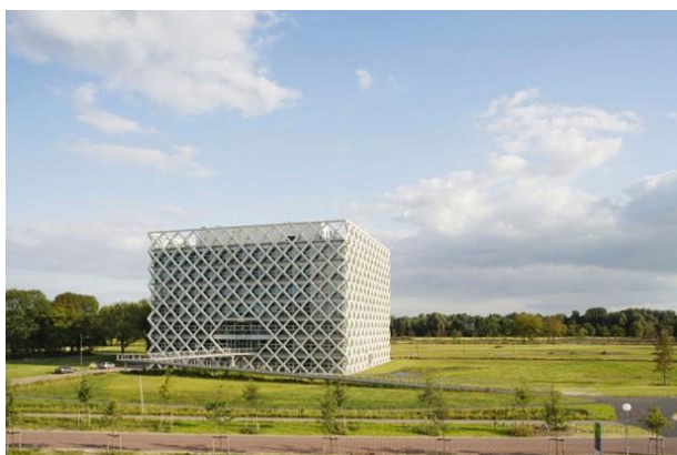
Wageningen Campus 2007

In paragraaf 2 is hiervoor een groenconcept geformuleerd en een aantal uitgangspunten om dit concept verder vorm te geven. Dit concept is gebaseerd op het verhaal van de ontwikkeling van het groen op de campus (paragraaf 3) en hoe zich dat verhoudt tot een aantal groenbegrippen zoals natuur, inheems en uitheems, ecosysteemfuncties en biodiversiteit (paragraaf 4).