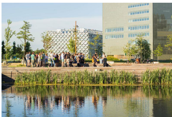
Vlonder bij vijver en Plein Forum