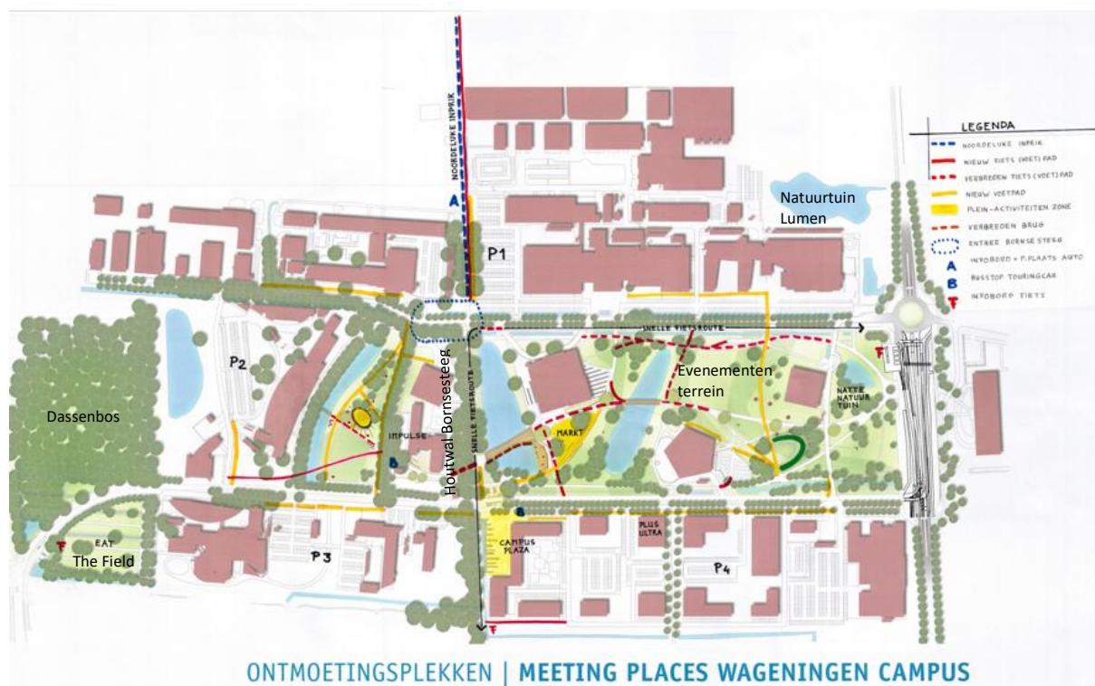
Figuur 2: Schetsontwerp Wageningen Campus uit maart 2015 met nieuwe inrichtings- en groenelementen (Bron: Werkgroep Levendigheid van het project 'Doorontwikkeling Wageningen Campus').

De gemeentes Wageningen en Ede hebben historische waarde-kaarten uitgebracht. Hierop is te zien dat Wageningen Campus vooral uit broekgebied bestaat van natte, plaatselijk lemige zandgrond, dat vanouds werd gebruikt als grasland. Dit landschap was min of meer regelmatig ingedeeld met sloten, (elzen)singels en lanen. Het grootste deel van de gronden was in de 19 e eeuw al verdroogd ten behoeve van akkers en bebouwing.