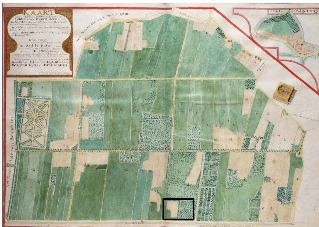
Figuur 1: Op deze kaart uit 1752 van de Bovendijkgraafse polders is aangegeven wie, welke grond in pacht had en voor welk doel. Van onder naar boven: Dijkgraaf, vijfde polder, Bornsesteeg, zesde polder, de Lange Steeg, zevende polder, Brink. Lichtgele delen zijn akkers. Op de drogere delen aan de randen werd daarop vooral tabak geteeld. Percelen aan de zuidkant (rechterkant kaart) met wat grotere groene stippen zijn boomgaarden. De plek van het huidige Dassenbos (in kader) werd gebruikt als 'Weij en Bouw Land' (16, noordelijk deel) en 'Akkermaal' (15, zuidelijke deel). Links op de kaart het 'Sterrebos' van Landgoed Nergena.

In de vroege middeleeuwen bundelen de bewoners hun krachten in buurschappen en richten lokale besturen in om de gronden gezamenlijk te beheren. Zij leggen wildwallen aan langs de randen van de Veluwe om de akkers te beschermen. Houtwallen, hagen en heggen dienen als erfafscheidingen en voor het leveren van nutshout en voedsel. Rond de 12 e eeuw nemen landheren het initiatief voor een systematische en omvangrijke ontginning van de lager gelegen delen. Zij maken het gebied van en rond de campus beter toegankelijk en bewerkbaar door bestaande beken en wegen recht te trekken en met elkaar verbinden (Dijkgraafse en Bennekomse polders). Houtwallen, elzensingels, knotwilgen, hakhoutbosjes en (natte) hooi- en weilanden worden aangelegd, evenals statige eikenlanen van het landgoed Nergena naar de stad Wageningen (figuur 1).