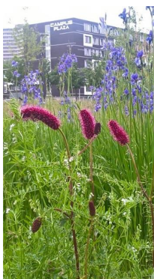
Bloemenweide met vaste planten tegenover terras van Orion. Wilde planten vermengen zich met uitheemse graslandsoorten als pimperlief (Sanguisorbia menziesii) en Iris sibirica (links), stermaagdenpalm (Amsonia orientalis) en vrouwenmantel (Alchemilla mollis).