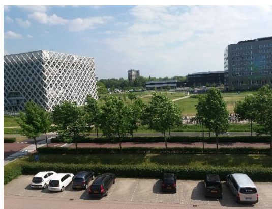
Wageningen Campus 2017 (onder) / 2019 (boven)