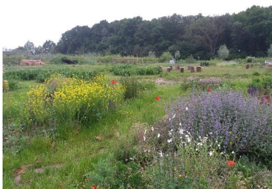
The Field, mei 2019, implementatie studentenproject Eetbare Academische Tuin (EAT, 2013)

Voor genoemde wensen zijn uitgewerkt in een integraal groenplan (2016). In overleg met WUR-deskundigen en studenten zijn vervolgens ongeveer 300 bomen aangeplant, waaronder de 'Tijdlijn van de appelproductie'. Bij Atlas is een natte variant van de natuurtuin bij Lumen aangelegd. Achter Vitae is een experimentele tuin ingericht, 'The Field', waar studenten en medewerkers kleinschalige, grondgebonden projecten kunnen uitvoeren. Diverse nieuwe gebruiksruidtes, zoals het amfitheater bij Impulse en het Plein voor Forum, zijn aangekleed met bomen en bloeiende heestergroepen (zie ook figuur 2). In afwisseling met gazons en ligweides is 10.000 m 2 bloemrijk hooiland ingezaaid.