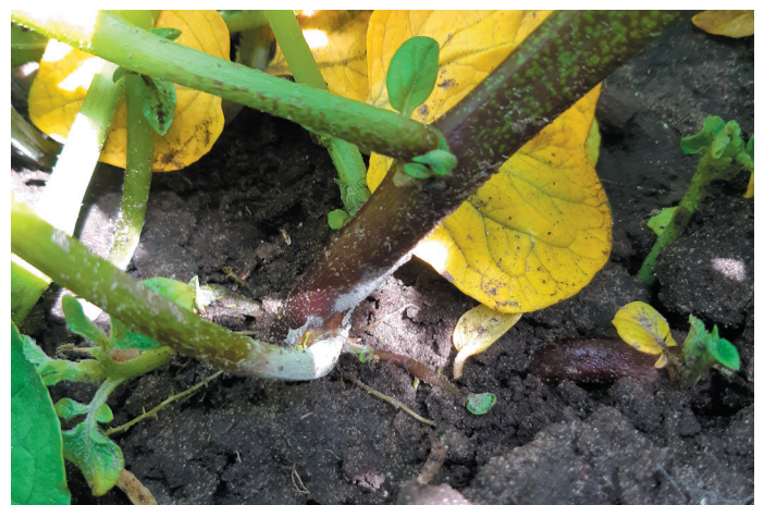
Groei van Rhizoctonia op stengel van aardappelplant

Het gebruik van biostimulanten die de (vroeg) groei bevorderen kan technisch gezien bijdragen aan een vermindering van de stengelaantasting. Er zijn echter nog veel open vragen over werkingsmechanismen en regelgeving op dit vlak. Gebruik van biostimulanten dus altijd even overleggen met je adviseur en eerst op een klein deel van het perceel toepassen.