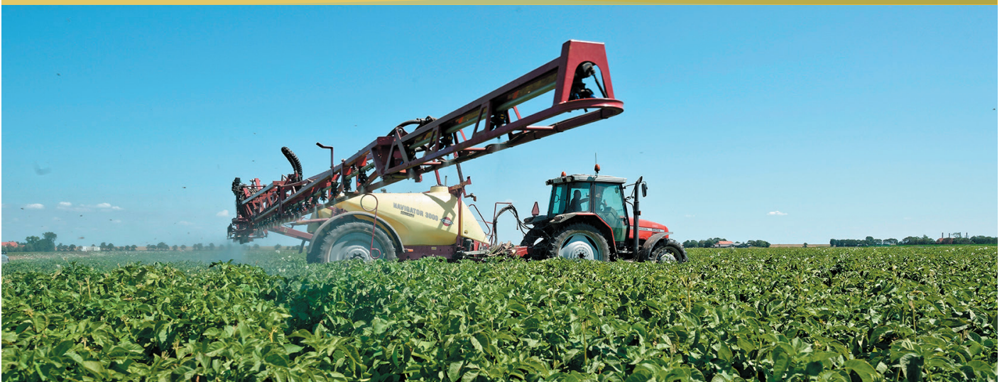
Afb. 6| Chemisch bestrijden van Phytophthora in aardappel, om resistentie te behouden

In het ideale geval wordt preventief gespoten voorafgaand aan voorspelde infectieperiodes. Weekschema's komen ook veel voor maar zijn geen garantie meer voor een continu beschermd gewas. Mocht er onverhoopt een infectieperiode gemist zijn dan kan curatief ingegrepen worden. Een bekende valkuil, denk aan 2021, is de snelle groeifase van het gewas. Onder hoge ziektedruk wordt de onbeschermd nieuwe groei vaak niet- of onvoldoende meegewogen wat resulteert in een te lang spuitinterval. De middelkeuze wordt in het algemeen afgestemd op de gewasfase en ziektedruk waarbij bescherming van nieuwe groei (1e helft seizoen) en knolbescherming (2e helft seizoen) bekende aandachtspunten zijn.