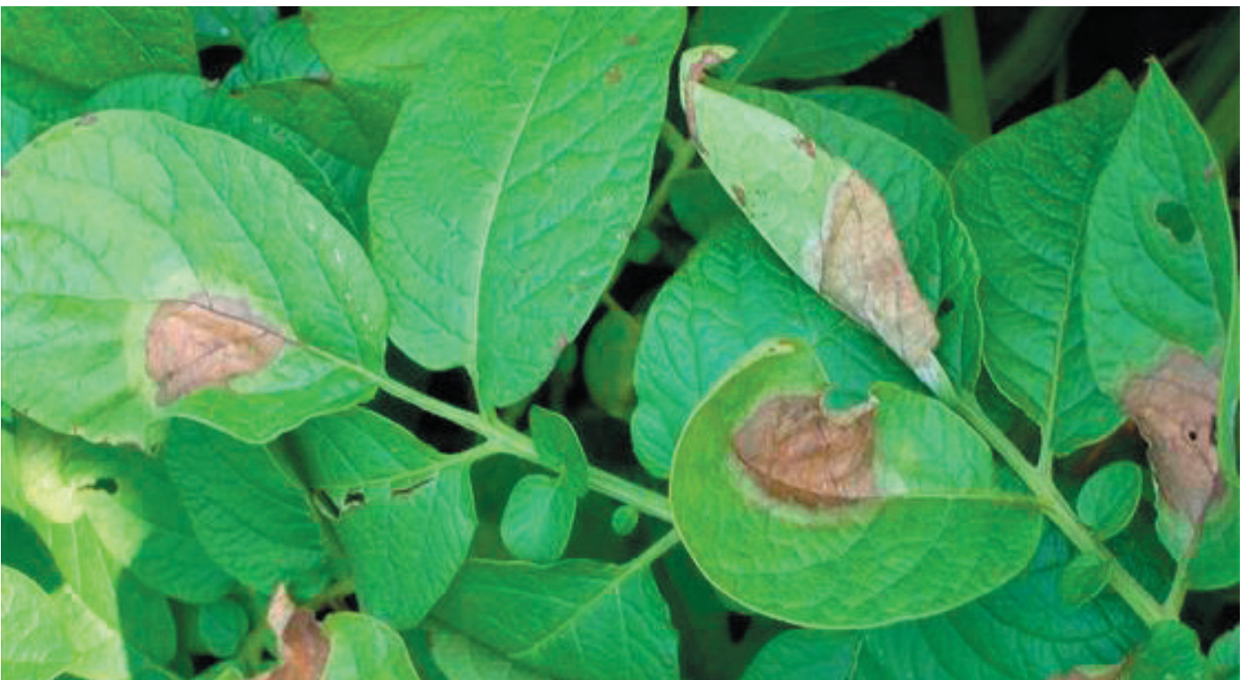
Afb. 5| Bladlesies veroorzaakt door P. infestans in aardappel

https://kennisakker.nl/archief-publicaties/de-aardappelziekte356