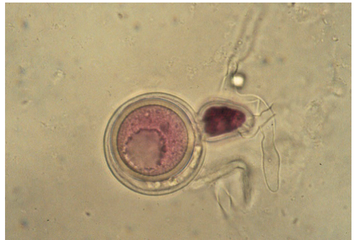
Afb. 4| Oöspore van P. infestans tijdens de generatieve voortplantingscyclus

Na afloop van deze latente periode verschijnen vrij plotseling de karakteristieke bladvlekken (afb. 1 en 5). In de praktijk betekent dit dat op het moment waarop de eerste bladvlekken worden waargenomen de volgende generatie bladvlekken al onzichtbaar, en in veel grotere aantallen, aanwezig is. Bladvlekken groeien snel en produceren grote hoeveelheden sporangia (enkele tienduizenden per cm 2 blad), zichtbaar als de typische 'witte halo' rondom de bladvlek. Deze infectiecyclus wordt per groeiseizoen veelvuldig voltooid en is de drijvende kracht achter de explosieve ontwikkeling die Phytophthora met regelmaat laat zien. Onder gunstige omstandigheden duurt het volbrengen van één infectiecyclus, van spore tot spore, 3 tot 5 dagen. Extreem korte cycli van 2,5 dag zijn echter ook waargenomen.