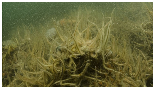
Figuur 2: Armen van brokkelsterren steken omhoog om voedseldeeltjes uit het water te filteren.

Brokkelsterren zijn filterfeeders en voeden zich voornamelijk met plankton (dierlijk plankton, maar ook diatomeeën) en dood organisch materiaal dat met de waterbeweging wordt aangevoerd. Om dit voedsel uit het water te halen steken ze twee of drie van hun armen verticaal in de waterkolom (Figuur 2). Met de borstelige haren op hun armen zeven ze het voedsel uit het water. Het ingevangen voedsel, verpakt in slijm, wordt met de armen naar hun mond toe gebracht. Bij stroomsnelheden van meer dan 25 \text{ cm sec}^{-1} stoppen ze met filteren en gaan ze plat op de bodem liggen (Allen, 1998).