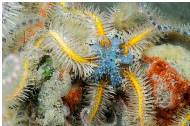
Figuur 1: Kleurrijke brokkelster

De brokkelster (wetenschappelijke naam Ophiothrix fragilis ) is een stekelhuidige uit de klasse van de slangsterren. Andere veel voorkomende slangsterren zijn de kleine slangster ( Ophiura albida ) en de gewone slangster ( Ophiura ophiura ), maar de brokkelster is eenvoudig te onderscheiden van deze slangsterren door de talrijke borstelige stekels op zijn armen (Figuur 1). Slangsterren lijken op zeesterren maar zijn duidelijk verschillend.