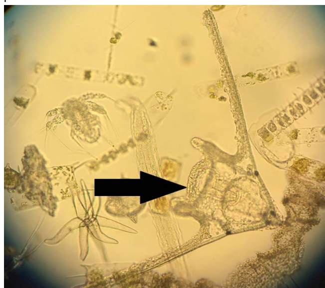
Figuur 4: Larve van een brokkelster (ca 1 mm groot).

de mosselen zitten. Ze kunnen soms met 10 000 exemplaren op 1 m 2 zitten. Als de waterbeweging wordt geremd door de armen die verticaal omhoog staan treedt er minder verversing van het water op. Tevens kan organisch materiaal en slib tussen de armen van de brokkelsterren makkelijker bezinken op het mosselperceel waardoor de zuurstofvraag van de bodem toeneemt en de zuurstofconcentratie in het water kan afnemen (Vopel e.a., 2003; Murat e.a., 2016). Dit kan schadelijke gevolgen hebben voor de mosselen op het perceel.