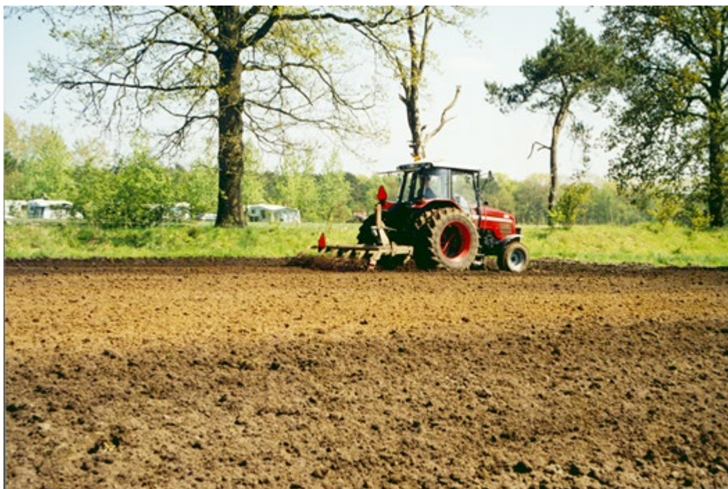
Onkruidbestrijding begint al met de grondbewerking.

later. Een vals zaaibed, een extra bewerking van de toplaag tot een diepte van circa 2 cm tussen ploegen en zaaien, verstoort de vroeg kiemende soorten. Het zaaien één of enkele weken uitstellen om een extra grondbewerking uit te voeren, wordt in de biologische teelt van maïs toegepast om onkruidbestrijding gemakkelijker te maken. Daarnaast is de beginontwikkeling van de maïs sneller omdat de gemiddeld de temperatuur dan hoger is.