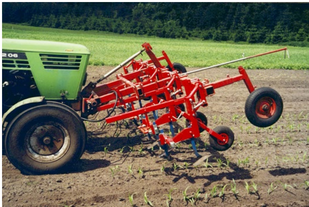
Frontschoffel met vaste schoffels.