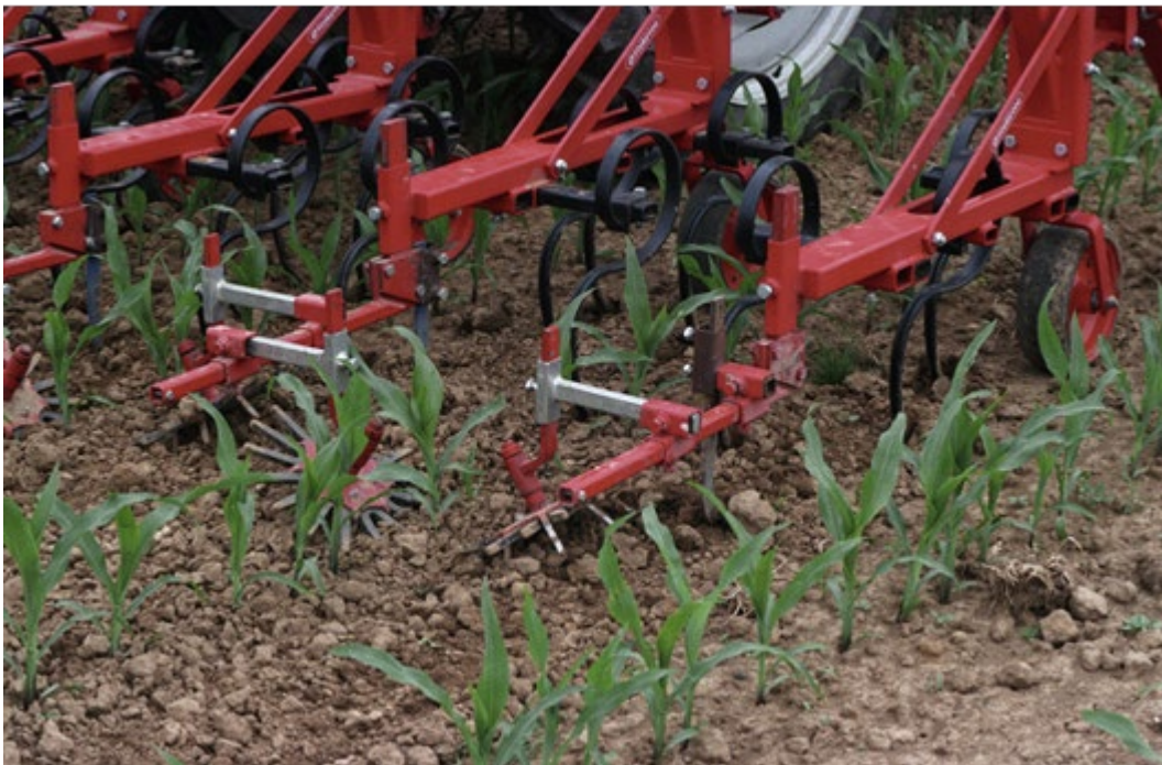
Trillandschffel plus vingerwieders.