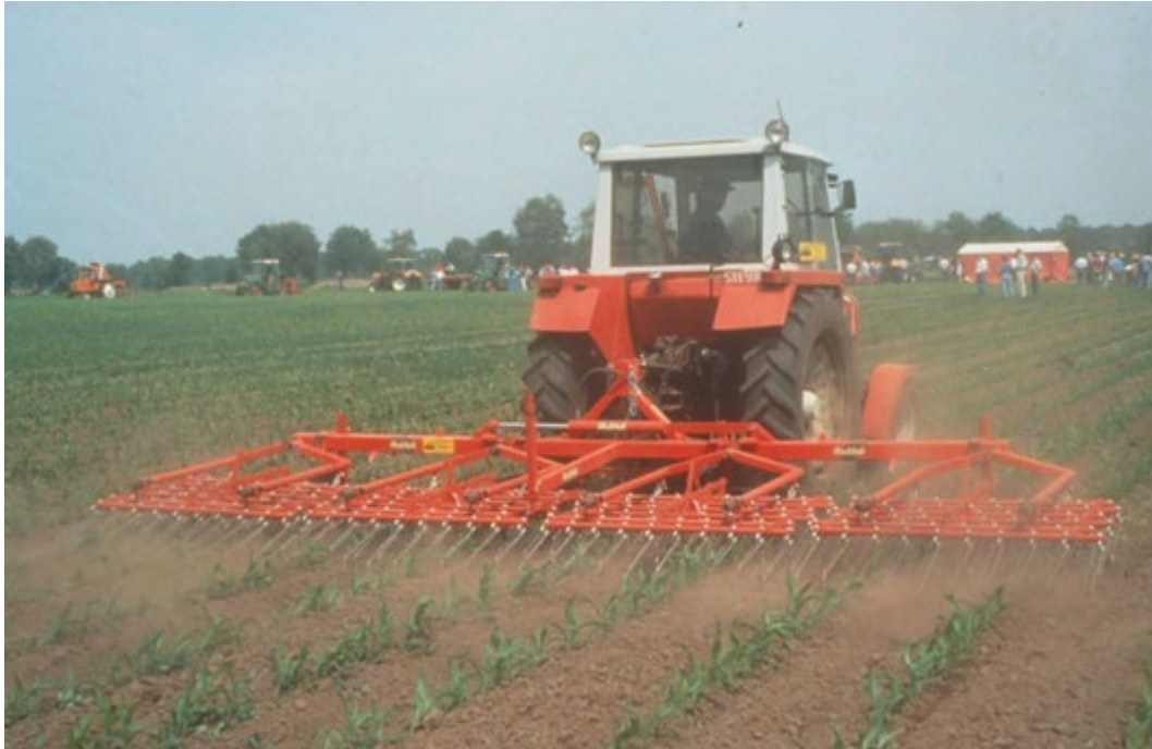
Eggen na opkomst van de maïs.