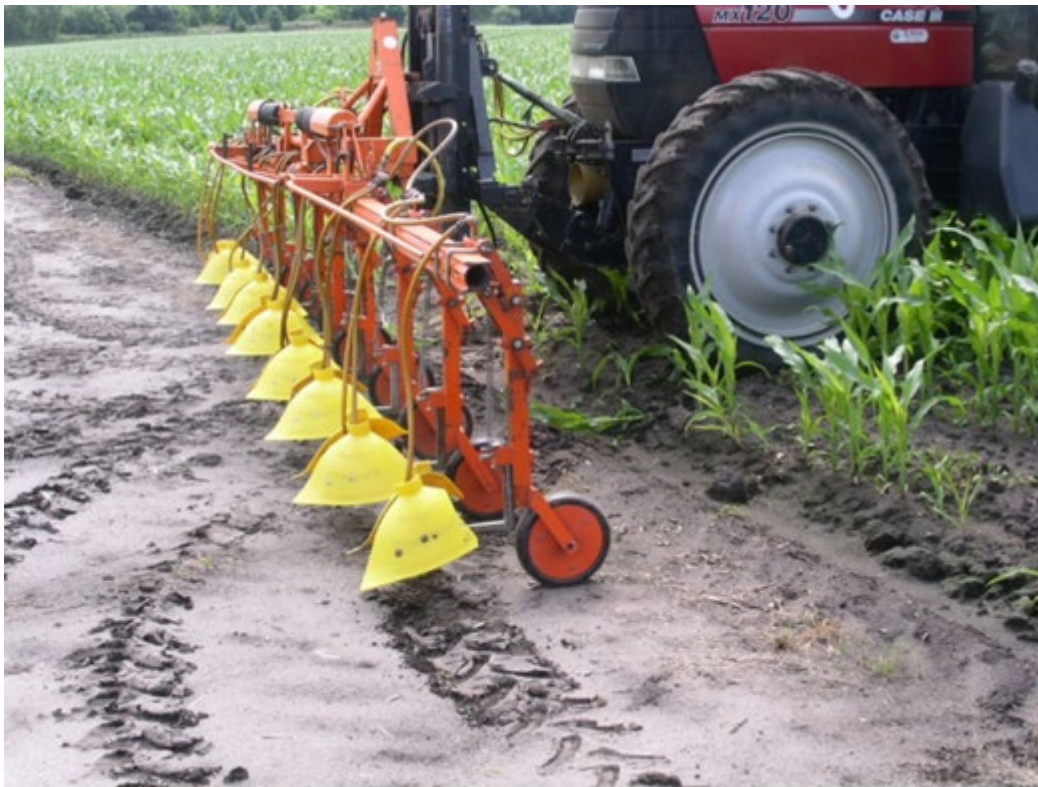
Kappenspuit onderblad bespuitingen.

Voor het zaaien en na de oogst van de maïs kan kweek ook mechanisch worden aangepakt. Een nieuw type frees uit Denemarken werkt met verende pennen (KVIK UP) gooit grond en kweekwortels omhoog. De kweekwortels komen bovenop de grond terecht. Daarna kan men ze bij elkaar harken en afvoeren. De machine werkt het best op lichte grond. Op zware grond kan beter een pennenfrees met vaste pennen worden gebruikt.