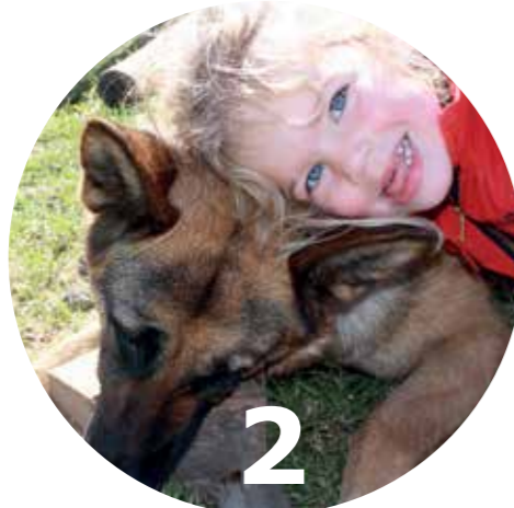
Pagina 8 Omgaan met dieren