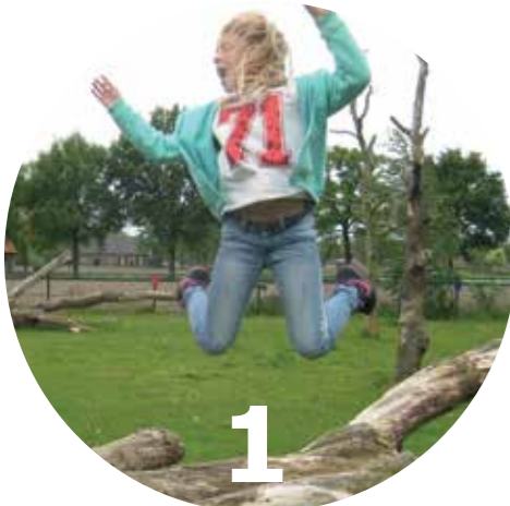
Pagina 5 Veel buiten zijn en bewegen