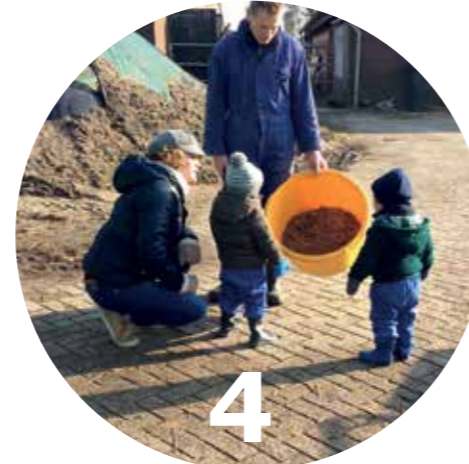
Pagina 16 Kinderen zien hoe voedsel wordt geproduceerd