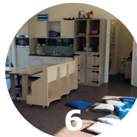
Pagina 22 Prikkelarme binnenruimte