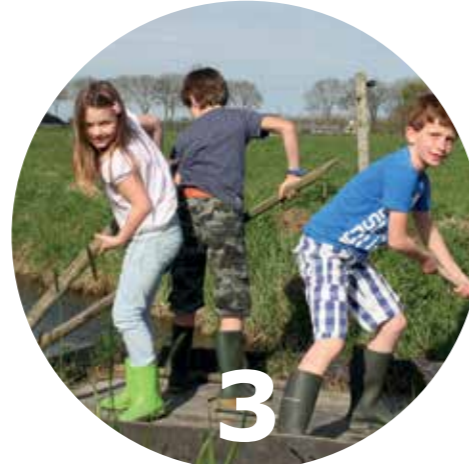
Pagina 12 Stimulerende groene omgeving