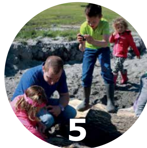
Pagina 19 Spelen met natuurlijke materialen