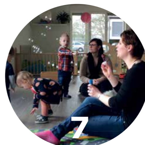
Pagina 24 De opvang is relatief kleinschalig en daardoor persoonlijk