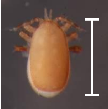
Figuur 3. Tropilaelaps sp. Een volwassen Tropilaelaps mijt is ongeveer 1 mm (witte lijn) lang.

Sinds Tropilaelaps naar een nieuwe gastheer ( A. mellifera ) is overgestapt is hij buiten zijn geografisch verspreidingsgebied aangetroffen. De mijtziekte komt nu ook in Afghanistan, Iran en zelfs in Kenia voor. Het is de vraag hoe lang het duurt voordat Tropilaelaps in Europa wordt aangetroffen. Voor verdere verspreiding is de mijt grotendeels afhankelijk van menselijk handelen, echter een geleidelijke 'natuurlijke' verspreiding van Centraal-Azië naar Europa is ook mogelijk.