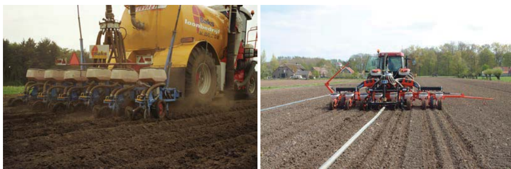
Zaaien en rijenbemesting met drijfmest in één werkgang Tegenwoordig kan dit ook in aparte werkgangen m.b.v. rtk-gps besturing

Men kan ook de drijfmest tijdens het zaaien in één werkgang toedienen. De drijfmest wordt daarbij aan beide kanten op een afstand van 8-10 cm van de rij geïnjecteerd. De machine bestaat uit een drijfmesttank waarachter een zaaimachine is gebouwd. Dit systeem is minder geschikt voor structuurgevoelige gronden. Daarom is er ook al een systeem ontwikkeld waarbij de drijfmest wordt aangevoerd met een sleepslangensysteem. Rijenbemesting met dierlijke mest geeft een betere werking van stikstof en fosfaat dan een vollevelds toediening. Evenals bij rijenbemesting met kunstmest wordt voor stikstof de factor 1,25 aangehouden. De betere werking van fosfaat is sinds 2010 in het advies geïntegreerd. Bij rijenbemesting met drijfmest is het over het algemeen niet mogelijk om meer dan 35-40 m 3 per ha netjes te injecteren. Veel loonwerkers ervaren de lagere zaaicapaciteit als bezwaarlijk. Tegenwoordig is het mogelijk om de rijenbemesting met drijfmest en het maïs zaaien in aparte werkgangen uit te voeren. De drijfmest wordt daarbij als rijenbemesting aangewend op 75 cm rijafstand m.b.v. automatische besturing met rtk-gps en deze gegevens worden daarna gebruikt door de trekker met de zaaimachine. Door deze methode is de zaaicapaciteit niet meer afhankelijk van de mest aanvoer capaciteit.