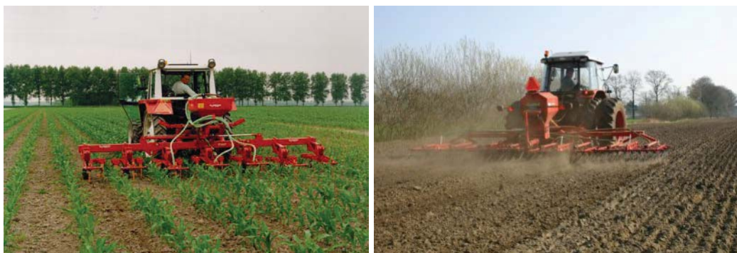
Italiaans raaigras kan in één werkgang met het schoffelen worden gezaaid (links) en Rietzwenkgras kan tussen zaaien en opkomst van de maïs met een wiedege plus zaaunit worden gezaaid (rechts)

In plaats van nateelt is het mogelijk om gras onder de maïs te zaaien. Dit beperkt de stikstofverliezen gemiddeld wat meer dan nateelt. Onderzaai kan wanneer de maïs 40-50 cm hoog is en bijna gesloten (3-4 bladstadium) met Italiaans raaigras of tussen zaaien en opkomst van de maïs met Rietzwenkgras. Bij onderzaai met Italiaan raaigras in het 3-4 bladstadium bepaalt het zaaitijdstip het succes van de teelt. Het gras moet op tijd worden gezaaid om zich voldoende te kunnen ontwikkelen, maar moet ook weer niet concurreren met de jonge maïsplanten. Men kan zaaien met een pijpenzaaimachine waarvan de pijpen boven de maïsrij zijn opgetrokken. Een andere mogelijkheid is om het in één werkgang met het schoffelen te zaaien. Per ha is 25-30 kg zaaizaad nodig. Rietzwenkgras is trager in opkomst dan Italiaans raaigras en kan daarom tussen zaaien en opkomst van de maïs worden gezaaid. Het kan gezaaid worden met een wiedege waarop een zaaunit is gemonteerd. Per ha wordt 15-20 kg zaaizaad geadviseerd. Bij onderzaai van gras dient men enigszins rekening te houden met het gebruik van verschillende bodemherbiciden bij de onkruidbestrijding. (zie hoofdstuk 8).