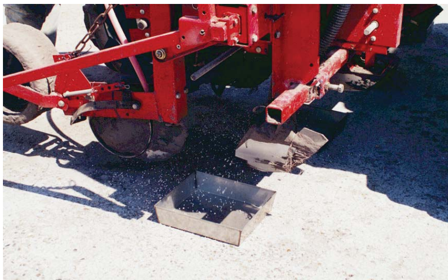
Rijbemesting stimuleert de jeugdgroei van maïs