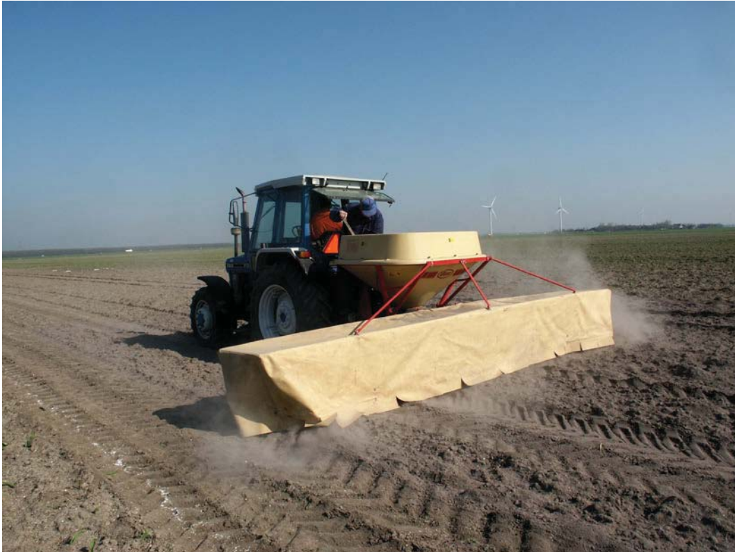
Een goede pH is een eerste vereiste

Bij giften groter dan 4000 kg nw adviseren we deze giften in meerdere keren te geven. In het algemeen worden giften groter dan 8000 kg nw niet geadviseerd. Pas vlak na een bekalking geen N-bemesting toe met een minerale meststof die ammonium bevat en/of organische mest, omdat dan extra verliezen uit deze meststoffen kunnen optreden.