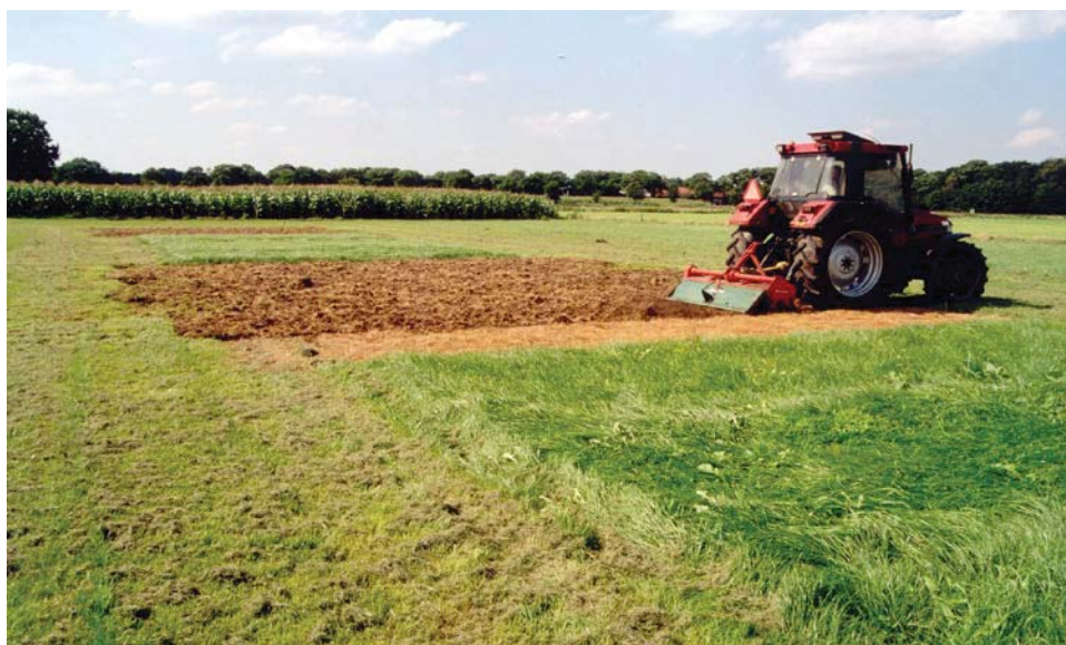
Bij scheuren komt veel stikstof vrij