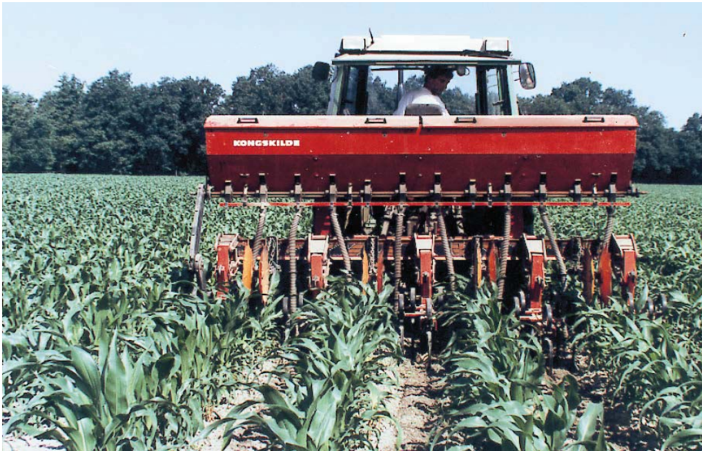
Bijbemesten is mogelijk tot het 6-bladstadium

Een Nmin-bepaling is alleen zinvol als het voorjaar uitzonderlijk koud en nat was waardoor twijfels bestaan over de beschikbaarheid van voldoende Nmin door geringe mineralisatie. Een bemesting na opkomst en vóór het 6-bladstadium is alleen lonend als de hoeveelheid Nmin lager is dan 175 kg/ha. In het algemeen wordt een strategie met gedeelde giften niet aanbevolen. De bemonstering voor de Nmin-bepaling voor het advies in juni dient 15 tot 20 cm naast de rij plaats te vinden en in het 3- of 4-bladstadium, zodat men een eventuele bemesting voor het 6-bladstadium kan uitvoeren.