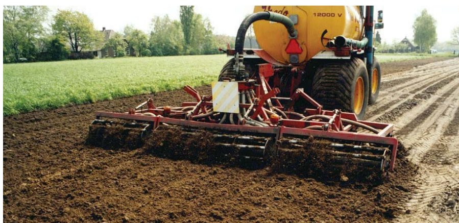
Injecteren geeft een goede mestbenutting

Ondiep inwerken kan men naast in tabel 5.20 genoemde methoden ook realiseren door diepe injectie voor het ploegen.