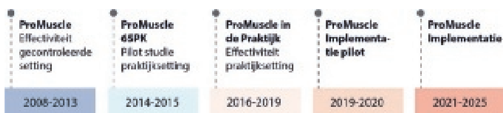
▲ Figuur 1. Tijdslijn: ontwikkeling en doorontwikkeling van ProMuscle.