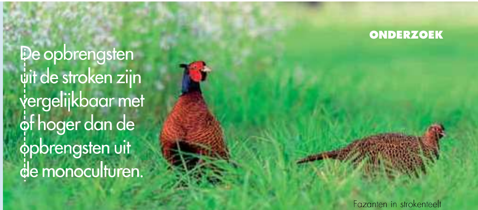
Fazanten in strokenteelt

De opbrengsten uit de stroken zijn vergelijkbaar met of hoger dan de opbrengsten uit de monoculturen.