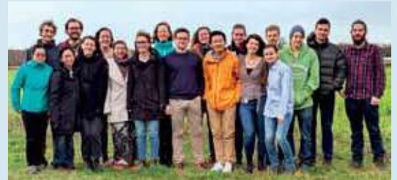
Het strokenteelt team 2019, bestaand uit PhD, BSc en MSc studenten

Op proeflocaties van WUR in Wageningen en Lelystad werd in 2019 gekeken naar het effect van het telen van gewasparen in stroken op verschillende ecosysteemdiensten, o.a. opbrengst, plaagbestrijding, biodiversiteit en gewaskwaliteit. Daarnaast werd er gekeken naar het effect van rassenmengsels en het gebruik van vlinderbloemigen in de stroken. In samenwerking met Mts. Rozendaal werden er in Strijen verschillende groenten in stroken gecombineerd met grasklaver. Ook het grootste strokenteeltextperiment van Europa van 42 ha bij ERF b.v., werd voortgezet in 2019. Hier werd voor het derde jaar op rij geëxperimenteerd met zes gewassen naast elkaar in stroken van 6, 12 en 24 meter breed. Het gemeenschappelijk