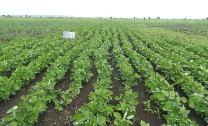
በእጅ የታረመ የማሾ ሰብል/ ማሳ