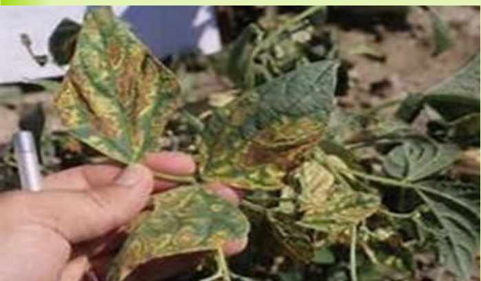
በባክቴሪያ የተጠቃ የማሾ ተክል