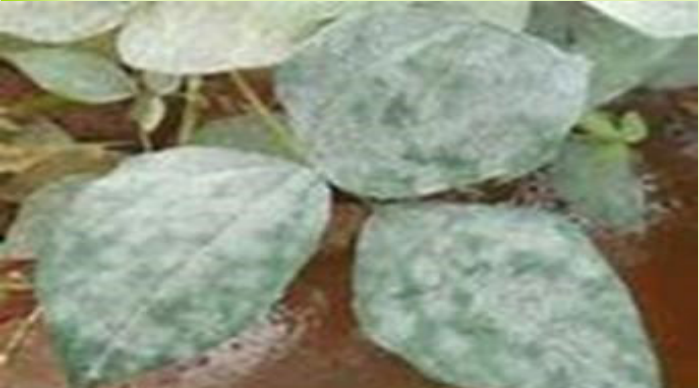
በአመዳይ የተጠቃ የማሾ ተክል