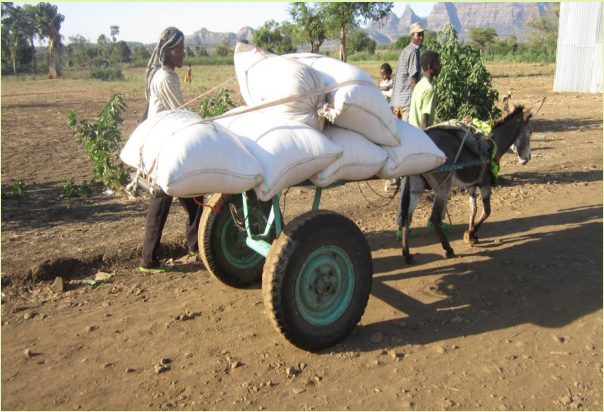
ማሾ በጋራ/ካሮ ሲጓጓዝ