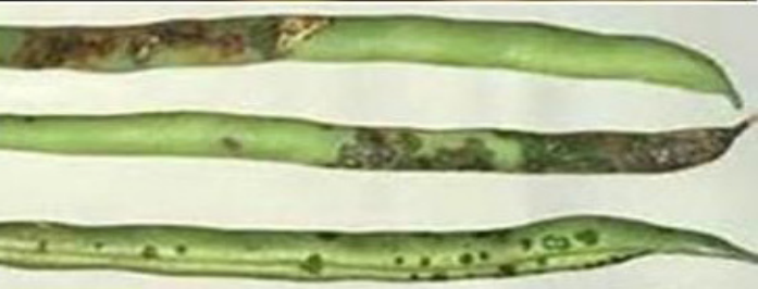
በመሀሉ ክፍት ጠባሳ የተጠቃ ቆባ