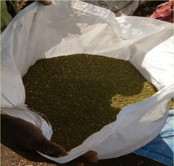
የተበጠረ የማሽ ዘር