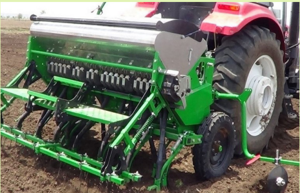
በትራክተር የሚጎተት ስፎጅያ የመስመር መዝራያ