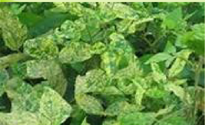
በብጫ ሞዛይክ ቫይረስ የተያዘ የማሾ ተክል