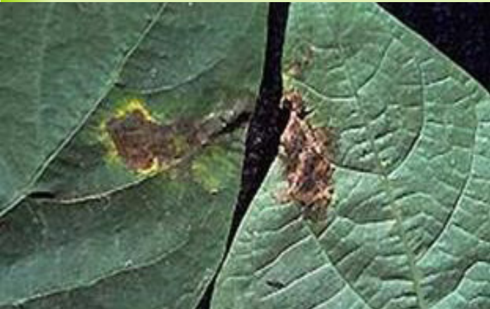
በቅጠል ጠባሳ የተጠቃ ቅጠል