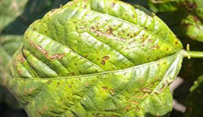
መሀሉ ክፍት ጠባሳ