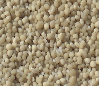
ኤን ፒ ኤስ ማዳበሪያ