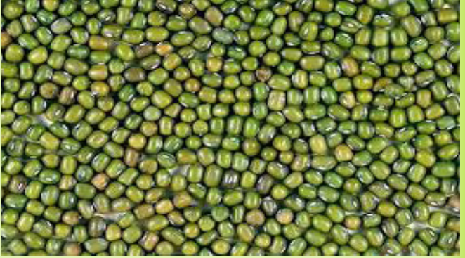
ለዘር የተዘጋጀ ንፁህ የማሾ ፍሬ