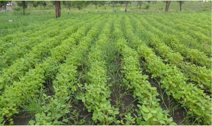
ያልታረመ የማሾ ማሳ