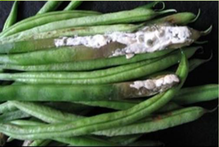
በነጭ ሻጋታ የተጠቃ ቆባ

ነጭ ሻጋታ፡- ይህ በሽታ እስክሌሮቲኒያ በተባለ የሻጋታ ዝርያ ይከሰታል። ቀዝቃዛ፣ እርጥበታማና ደመናማ ዓየር ይመቸዋል። በሽታው ሥሩን፣ ግንዱንና ቆባውን ሊያጠቃ ይችላል።