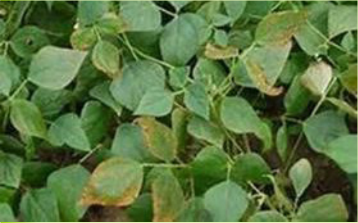
በባክቴሪያ የተጠቃ የማሾ ተክል