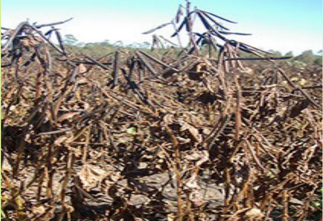
ለአጨዳ የደረሰ የማሾ ተክል