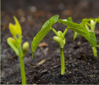
በሚፈለገው ርቀት የበቀለ የማሾ ቡቃያ