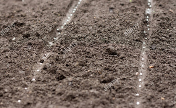
ከ30-40 ሳንቲ ሜትር ርቀት ጠብቆ ዘር መዝራት