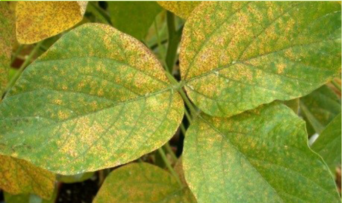
በዋግ የተጠቃ የማሾ ተክል