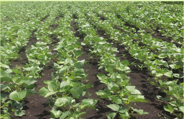
በመስመር የተዘራ የማሾ ሰብል