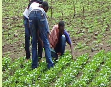
በዝቶ የበቀለ ሰብል ሲቀነስ